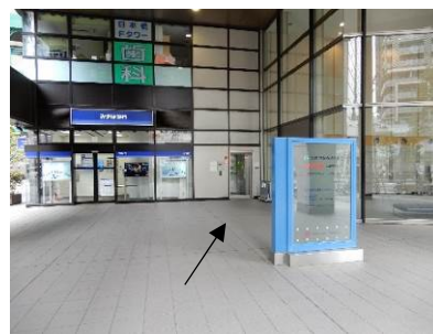
出入口（写真右の正面入口は閉鎖のため矢印の位置（通用口に関係者がいます）。