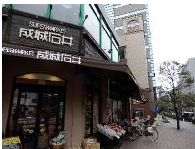
浜町中ノ橋交差点から清洲橋通り沿いを望む